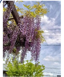
ありまつ公園の藤 まちの風景