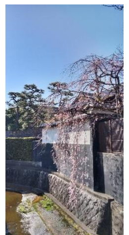
藍染川沿いの しだれ桜