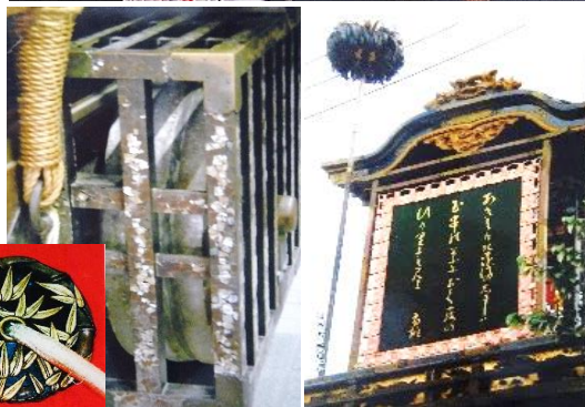
螺鈿細工 見送り幕