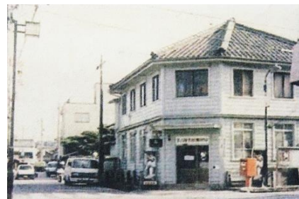
洋館時代の有松郵便局