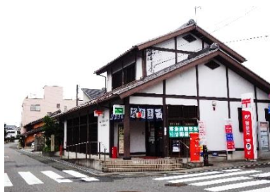
現在の有松郵便局

現局舎は町並みの景観に合わせた町屋風の建物に平成10年新築されました。ポストも景観に合わせ平成11年に碧南市から丸型を移設しました。