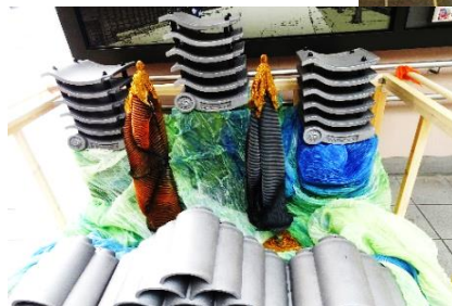
シンボルオブジェ(有松駅)