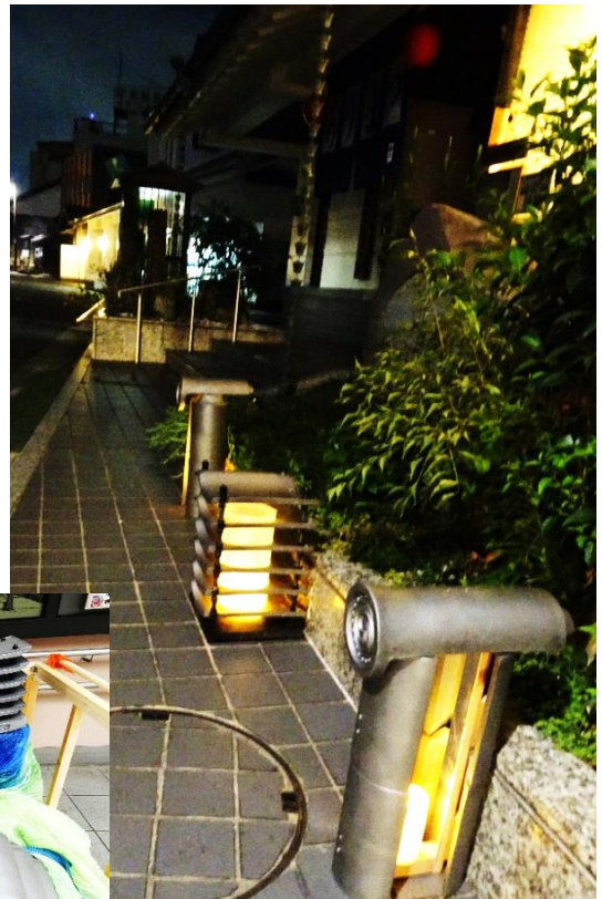
灯りストリート(絞会館前)