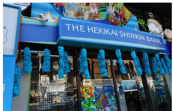
碧信本店入口の形状記憶の絞りのれん

今年の安城七夕まつりは、竹あかり回廊や安城七夕神社の新御朱印の発行などが加わり、来場者は3日間で110万人（昨年は104万人）となりました。