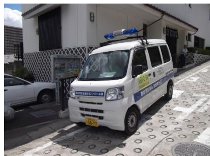
青色防犯パトロール車

「昨年、区政協力委員になり初めて青パトに乗りました。緑警察署で講習を受け、パトロール実施者証をもらい乗務してきました。平成18年に緑区内では有松学区が最初に、区政協力委員を中心に始められた事業だといいますが、今は防犯連絡員、老人クラブ、ボランティアも加わっています。少しでも犯罪が抑止されるよう都合のつく限り乗務していきたいと思っています。」